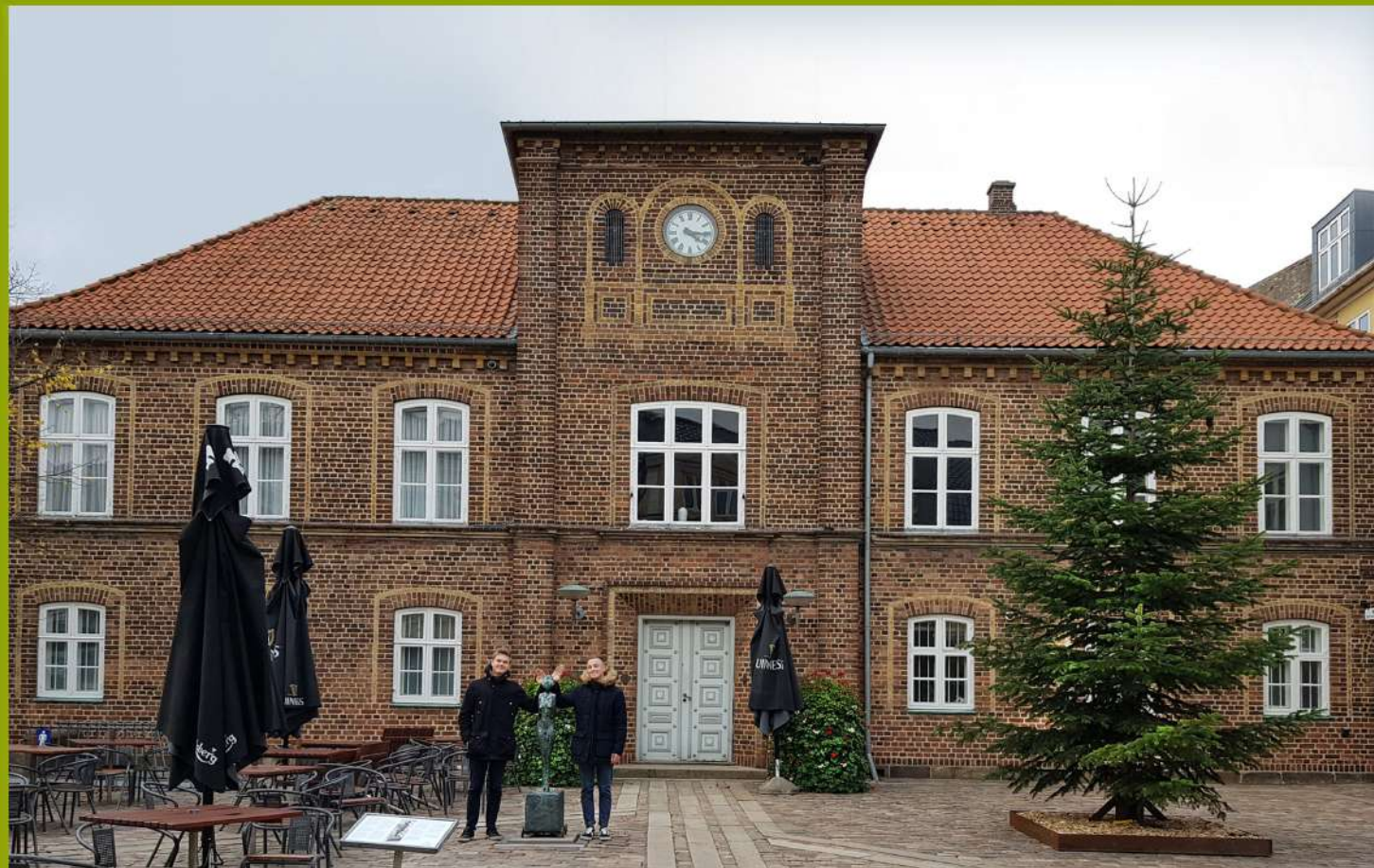
Holstebro simbols ir Alberto Giacometti skulptūra "Sieviete uz ratiņiem-bronzā"

1966. gadā pilsētas mērs iegādājās šo "vājās sievietes" skulptūru par DKK 210000. Tas izraisīja "vētru" sabiedrībā - tik daudz naudas par tādu niecīgu tēlu. Reakcija bija - Mārenai pie kājām tika liktas pārtikas pakas, lai tā "varētu kaut nedaudz svara iegūt". Laika gaitā cilvēki to ir iemīļojuši, tā ir arī mākslas simbols, miljonu vērts. Katru vakaru tā tiek nolaista uz zemes, lai "droši gulētu". Apskatīt to var no plkst. 9:00-21:00.