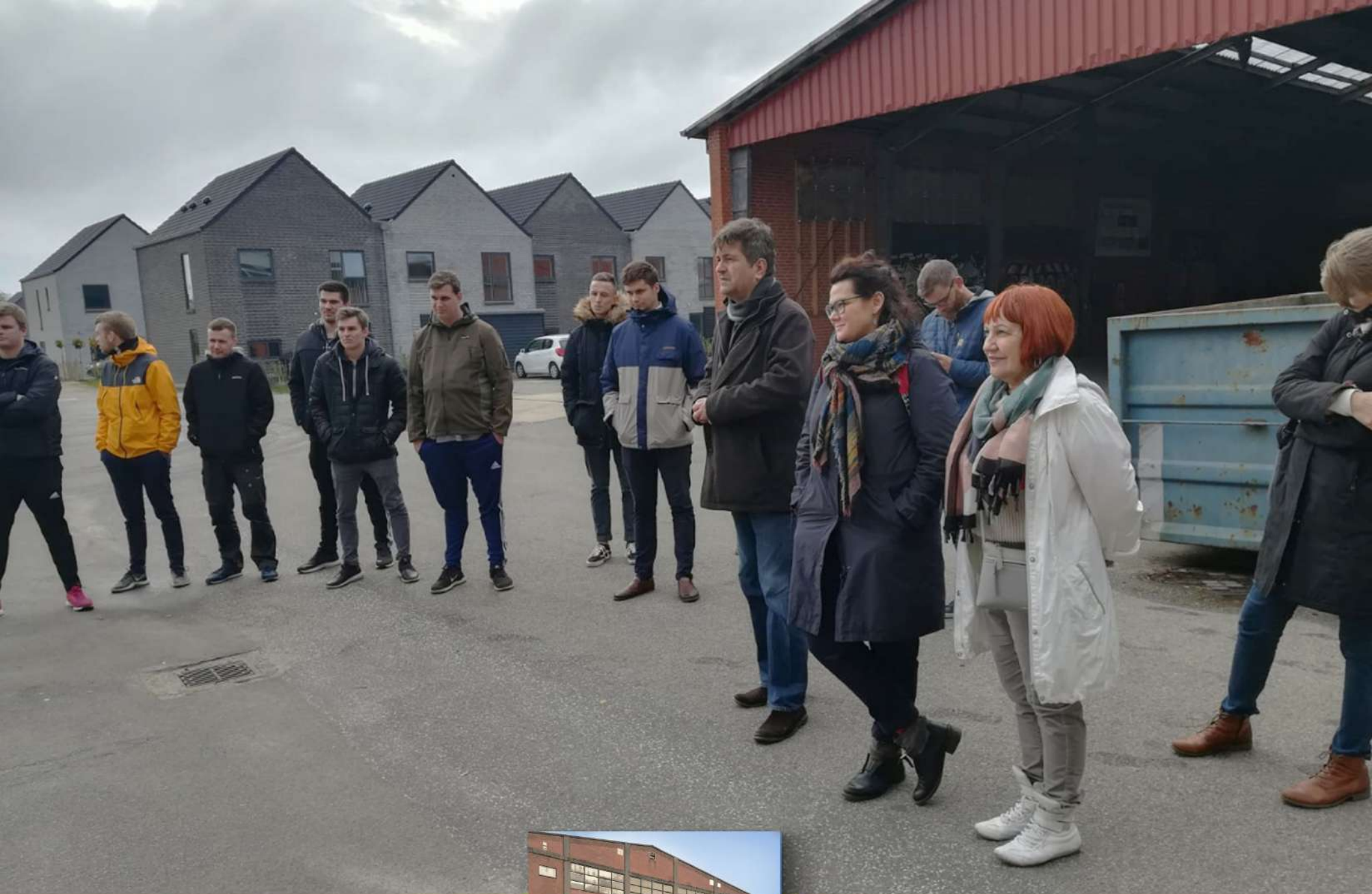
Ražošanas ēka Slaughterhouse