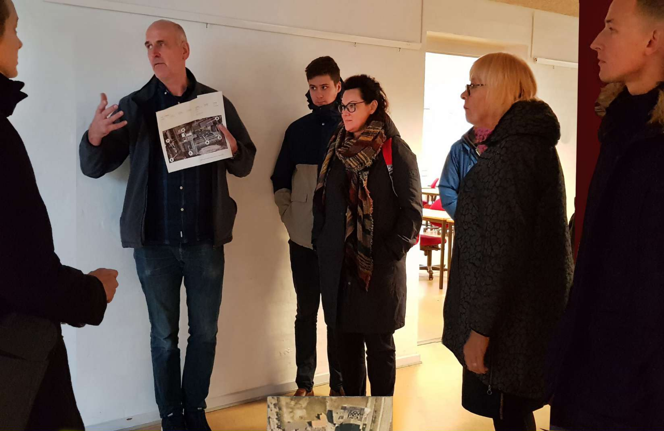
VIA University College pasniedzējs