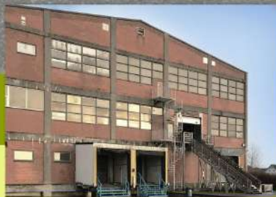
Iepazīšanās ar renovējamo objektu