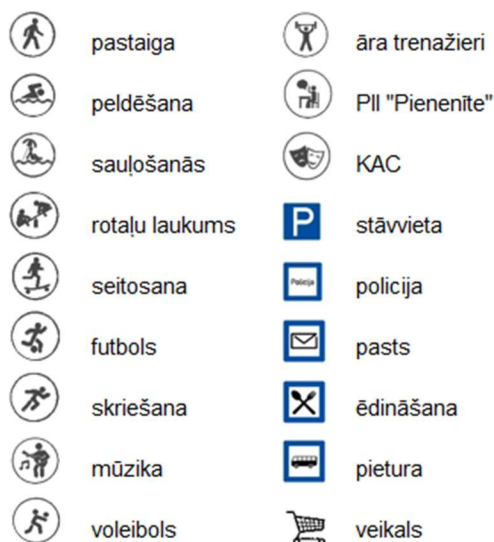
2. attēls. Esošā situācija – apbūves struktūra un pieejamās aktivitātes

Veiktā aptauja apliecina, ka ezera publiskās ārtelpas pieeja Ulbrokas ciema iedzīvotājiem ir ļoti nozīmīga un nepieciešama. Tas nozīmē, ka ezera apkārtnes infrastruktūrai jābūt labiekārtotai. Vairākums respondentu uzskata, ka pieejamais Ulbrokas dzirnavezera